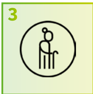
3 Denk aan kwetsbare mensen