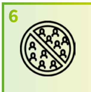
6 Volg de regels voor bijeenkomsten

Voor de meest recente maatregelen, check steeds www.info-coronavirus.be of www.zedelgem.be/corona