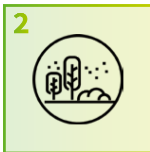
2 Doe je activiteiten liefst buiten