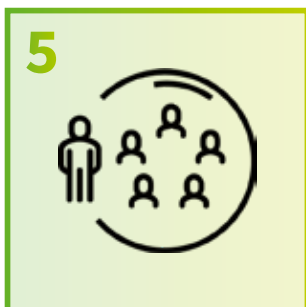
5 Beperk je nauwe contacten volgens de geldende maatregelen