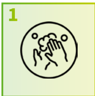
1 Respecteer de hygiëneregels

Blijf de 6 gouden regels tegen de verspreiding van COVID-19 volgen!