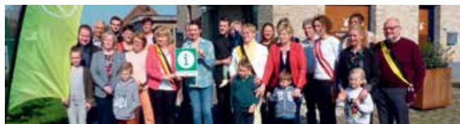
Groepsfoto Infopunten Toerisme, in elke deelgemeente van Zedelgem minstens één infopunt.