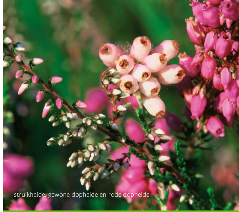
struikheide, gewone dopheide en rode dopheide